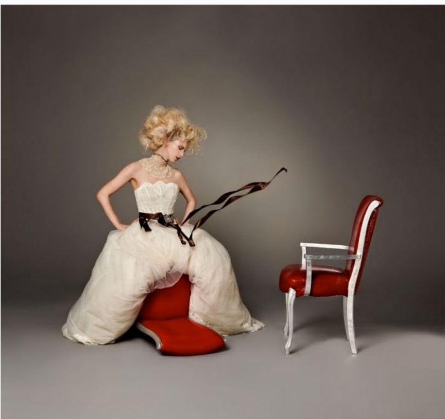
Una ristrutturazione aziendale e una nuova immagine rilancia, al Salone Internazionale del Mobile di 2011, lo stile del brand Modonutti, sempre più vicino alle atmosfere dell'arte, del design e della moda.

È all'insegna dell'innovazione e della raffinatezza, la nuova immagine che CModonutti, in occasione della Cinquantesima edizione del Salone Internazionale del Mobile di Milano (12-17 aprile 2011), ha presentato alla stampa e a clienti nuovi e consolidati. Un aspetto rivoluzionato a cominciare dal nome. Da "CM Chairs Modonutti" infatti, l'azienda diventa "CModonutti": pur rimarcando gli elementi che hanno fatto e continuano a fare grande questo brand – l'unione tra artigianalità e tecnologia, il Made in Italy e la creatività – l'azienda si apre a nuove prospettive estetiche e al mercato retail, consolidando non di meno l'universo contract.